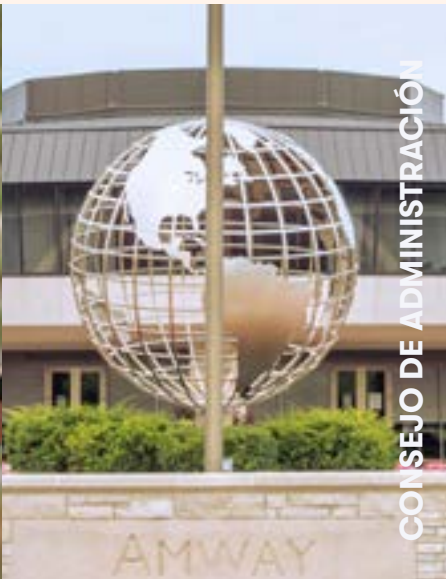
CONSEJO DE ADMINISTRACIÓN