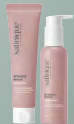
ESTILIZA CREMA Y SUERO

*Imagen del masajeador es de carácter ilustrativo. El uso de un masajeador es una recomendación de herramienta para incluir en la rutina de cuidado capilar, sin embargo, este paso es solo una sugerencia, puede realizarse con los dedos u omitirse.